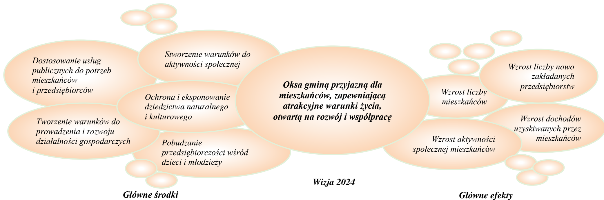
Rysunek 2 Drzewo celów